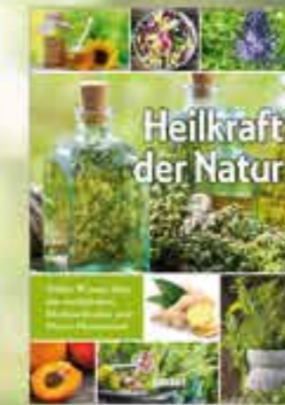
Heilkraft der Natur 978-3-7359-1299-2