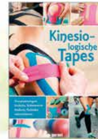
Kinesiologische Tapes 978-3-7359-1290-9 128 Seiten