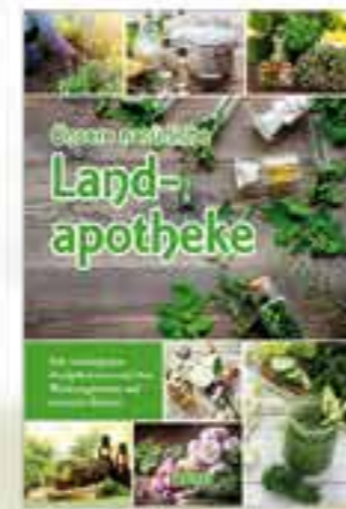
Unsere natürliche Landapotheke 978-3-7359-1891-8