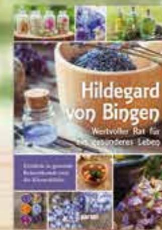
Hildegard von Bingen 978-3-7359-1353-1