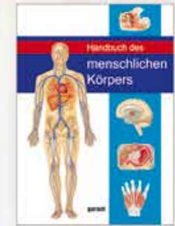
Handbuch des menschlichen Körpers 978-3-7359-1300-5