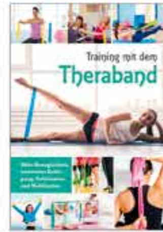
Training mit dem Theraband 978-3-7359-1698-3